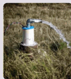
Deep well pump