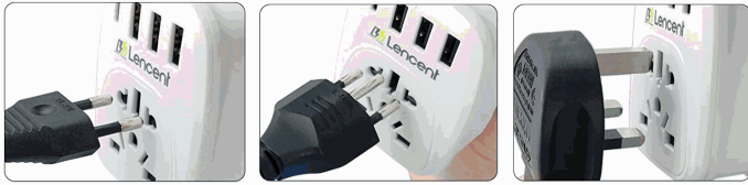
EU - Type C/E/F