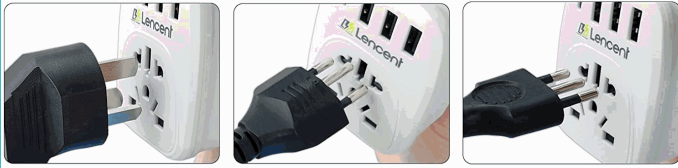
Australia - Type I