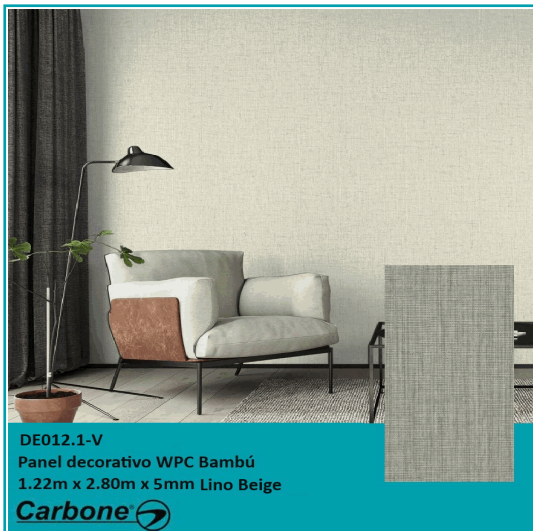
DE012.1-V Panel decorativo WPC Bambú 1.22m x 2.80m x 5mm Lino Beige

Panel Decorativo Wpc Bambú 1.22 M X 2.80 M X 5 Mm Tela Lino Beige