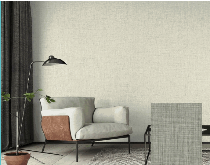
DE012.1-V Panel decorativo WPC Bambú 1.22m x 2.80m x 5mm Lino Beige