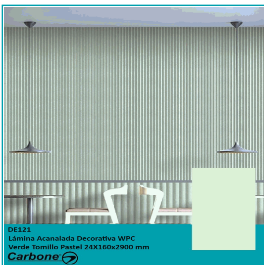
DE121 Lámina Acanalada Decorativa WPC Verde Tomillo Pastel 24X160x2900 mm Carbone

Lámina Acanalada Decorativa Wpc Verde Tomillo Pastel 24X160X2900 Mm Para Paredes, Techos, Muebles, Compuesto Madera Y Plástico. 24X160X2900 Mm