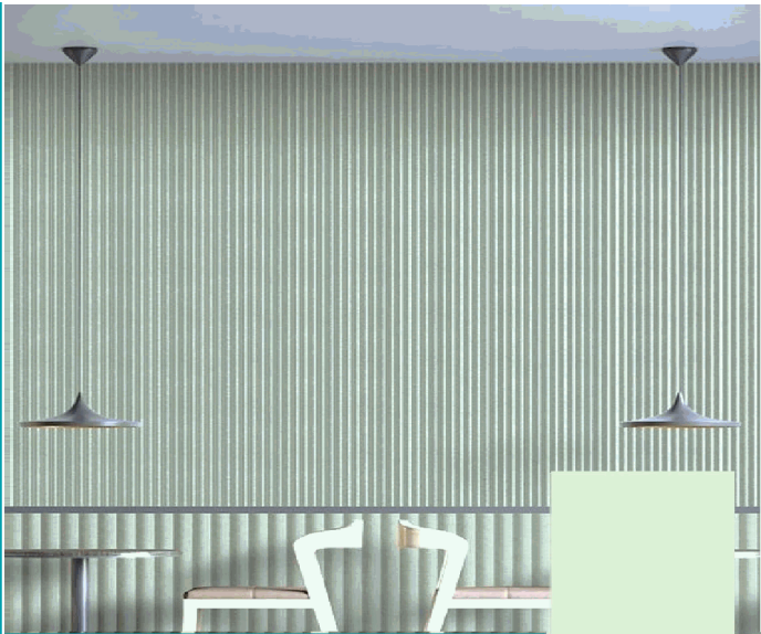
DE121 Lámina Acanalada Decorativa WPC Verde Tomillo Pastel 24X160x2900 mm