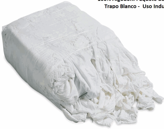
100% Algodón. Paquete de 15lb. Trapo Blanco - Uso Industrial