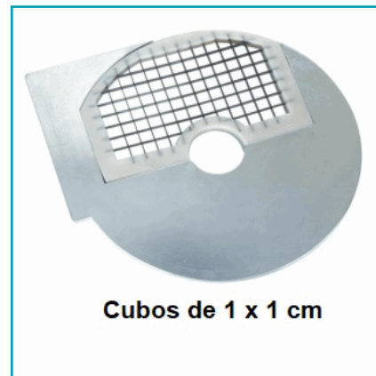
Cubos de 1 x 1 cm

¿Dónde usarlo?: Cocinas, restaurantes, y servicios de catering.