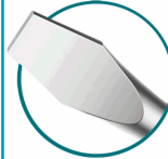
1Pcs screwdriver with 1Pcs plastic hanger