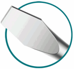
1Pcs screwdriver with 1Pcs plastic hanger