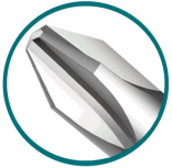
1Pcs screwdriver with 1Pcs plastic hanger