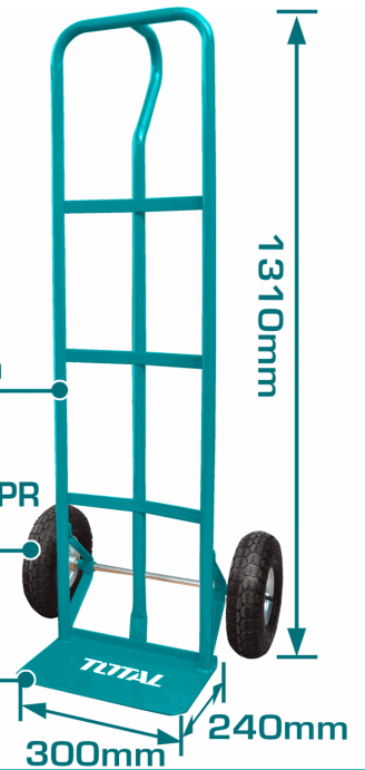
Plate thickness: 3.5mm