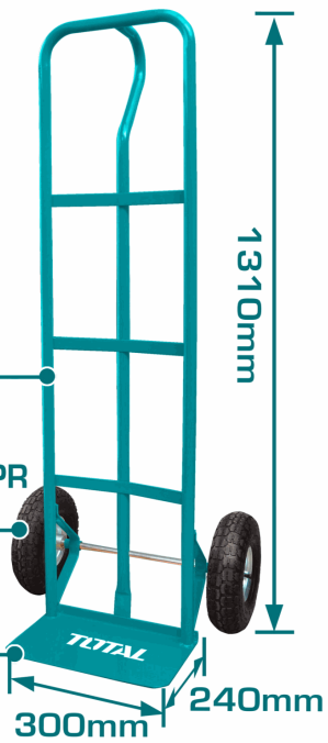
Plate thickness: 3.5mm