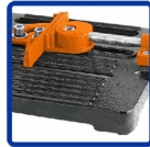
Cast Iron Base